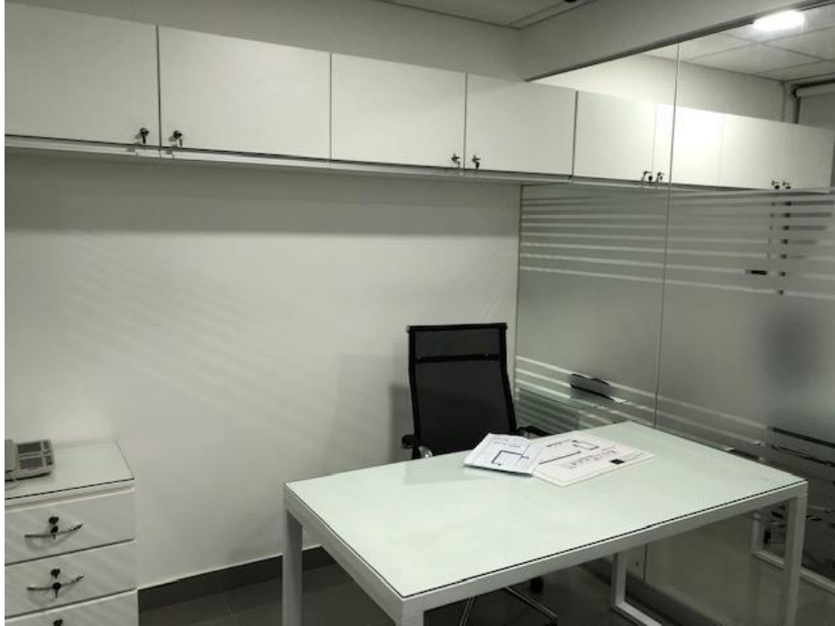
OFICINA N° 2