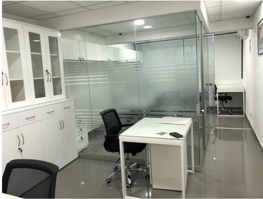
OFICINA N° 1 : RECEPCION