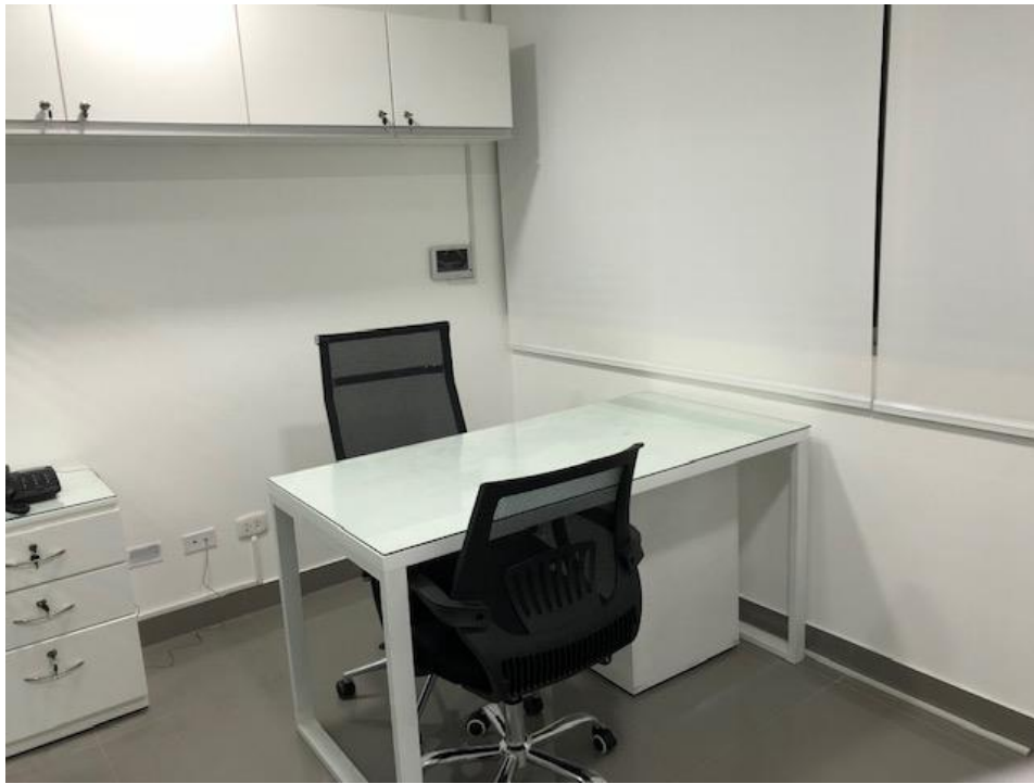
OFICINA N° 3